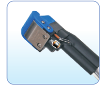
直驱感应式刀头 Direct drive thread trimmer cutter head