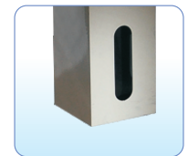
自动微油装置 Auto Slightly oiling device